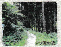
奥多摩観光駅長 スズキ 村木 鈴江